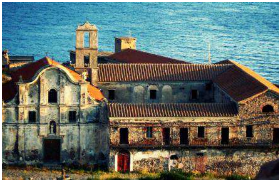
Una delle sedi di grande suggestione del Capraia Musica Festival

Torna la rassegna dedicata alla musica da camera. Tra gli ospiti Bacchetti, Barabino e Anna Kravtvenko. Con un concerto dedicato al tango