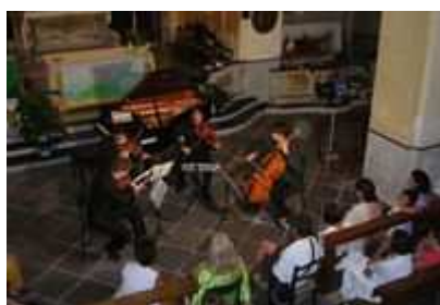
Una serata del festival - Capraia Musica Festival