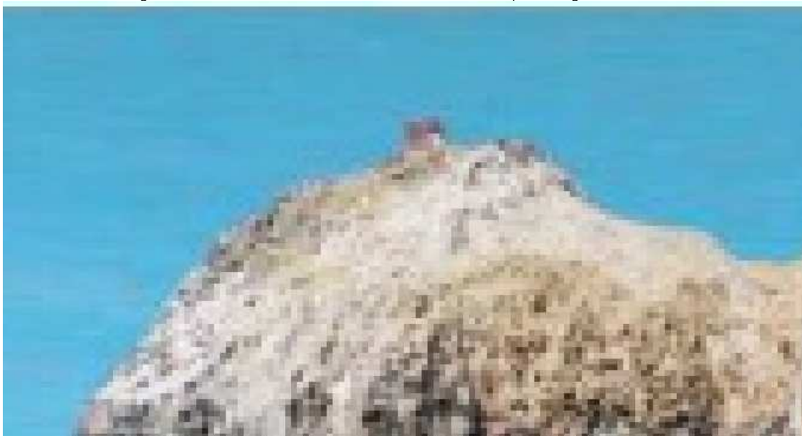
Capraia Musica Festival

Tutti i concerti si svolgeranno nella Chiesa di Sant'Antonio e saranno offerti al pubblico gratuitamente